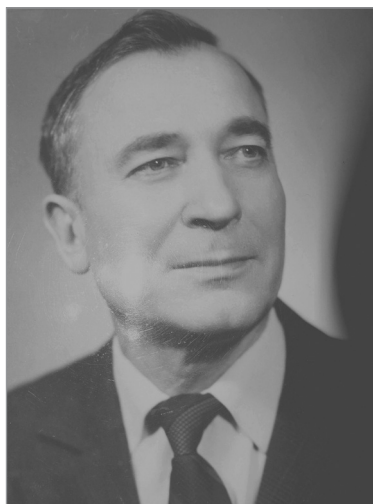
Микола Тимофійович Лисенко